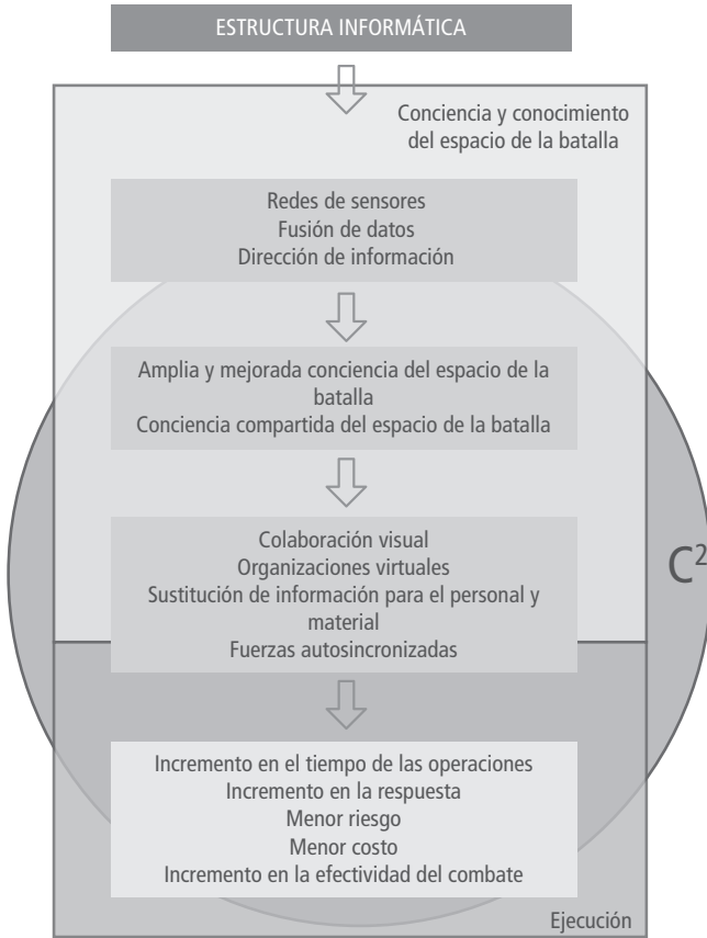
Figura 1. La organización militar como una empresa centrada en redes