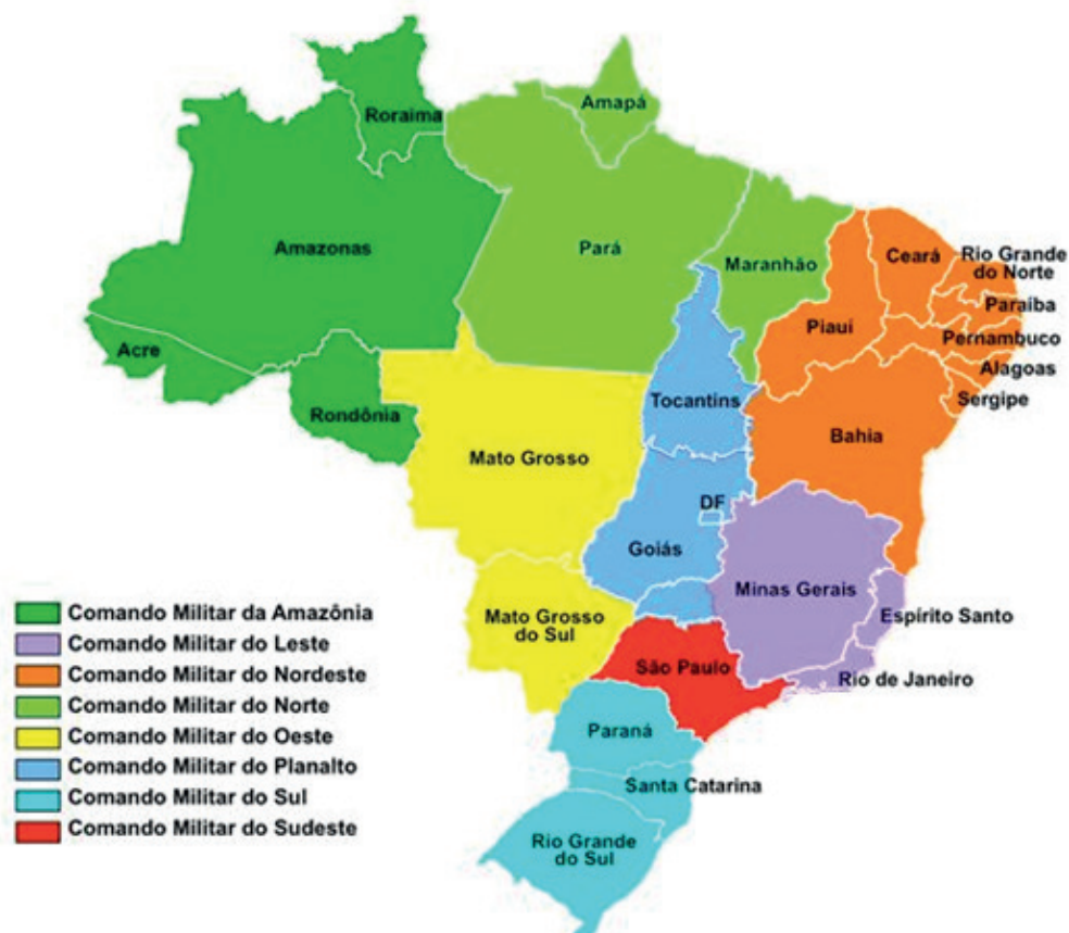
Mapa 1. División regional de la Fuerza Terrestre.

De igual manera, también se encuentran los Comandos Logísticos y Administrativos, nombrados en doce (12) Regiones Militares (RM), que están bajo autoridad de los Comandos Militares de Área.