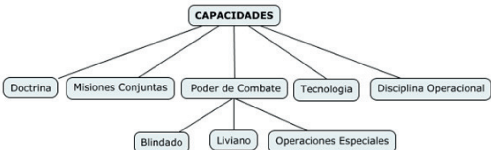
Figura 2. Capacidades tradicionales Ejército de Colombia. Elaboración propia basada en documentación consultada

Estas capacidades se ciñen a las condiciones y direccionamiento dados por el comandante superior, quien con cuyo ejemplo personal, y una serie de condiciones propias del liderazgo, enseñan al soldado a actuar debidamente, aun en ausencia de su superior.