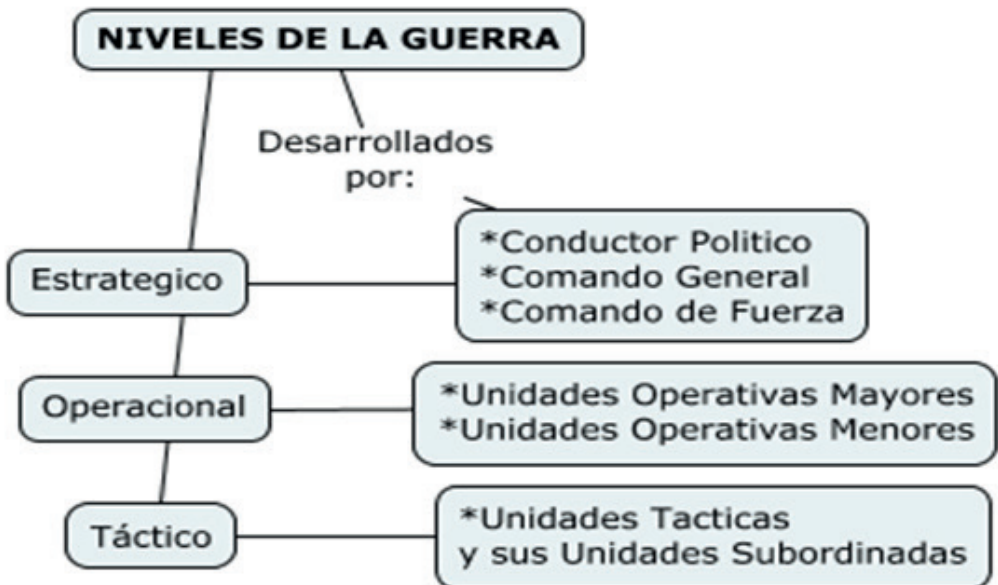
Figura 3. Niveles de la guerra. Elaboración propia basada en documentación consultada

De acuerdo con esta definición, el nivel de guerra aplica no solo a la guerra misma sino también a las operaciones no bélicas, las cuales también son conocidas como operaciones de cooperación. Para el caso de Ejército Nacional de Colombia, como máximo exponente del Poder Terrestre, este es táctico,