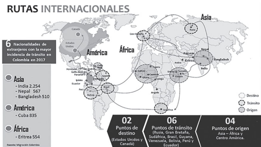
Figura 4. Rutas de Migración para llegar a Colombia