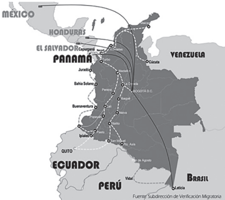
Figura 5. Rutas Migratorias identificadas en Colombia