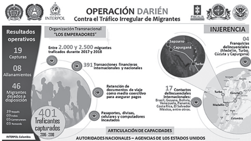
Figura 2. Impacto de la migración irregular de personas