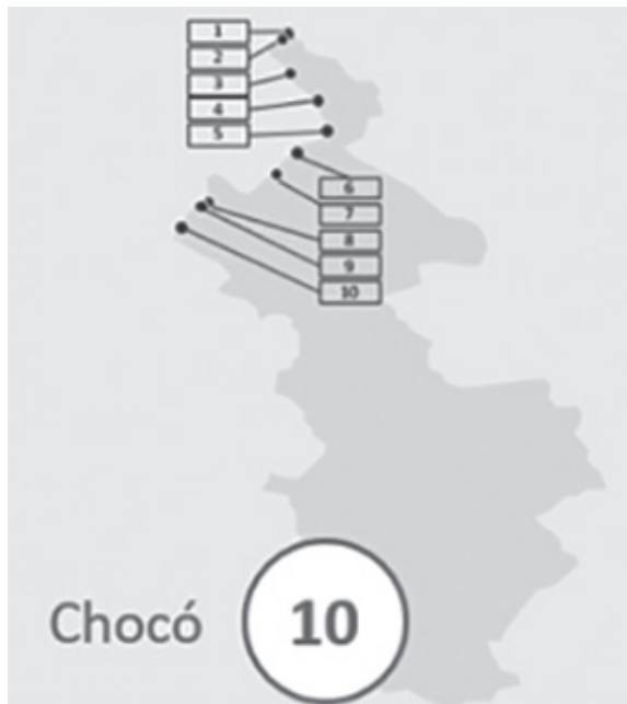
Figura 1. Rutas terrestres informales.

En el caso particular del Chocó, existen tres pasos formales -todos marítimos, ninguno terrestre- a saber: Puerto Marítimo de Turbo, Puerto Marítimo de Capurganá y Puerto Marítimo de Juradó. Por otra parte, se evidencian 10 cruces terrestres informales: (1) Sapzurro, (2) Los Girasoles, (3) La Diabla, (4) Casa Roja, (5) La Cabaña, (6) Cristalino, (7) San Blas, (8) Cruce, (9) Alto Aspave y (10) Santa Teresita.